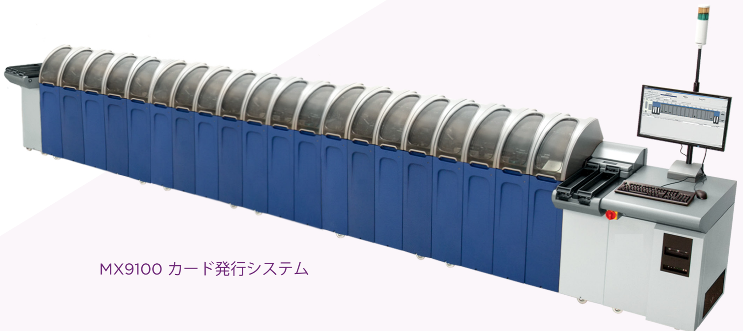
MX9100 カード発行システム

サービスおよびサポート： MX シリーズ プラットフォームは、150 か国以上にまたがるグローバルな業界最大のサービスおよびサポート ネットワークに支えられています。オンラインおよび電話によるサポートを 24 時間年中無休でご利用いただけます。